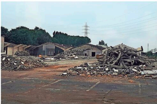
De sloop van de oude bedrijfsgebouwen is volop bezig.

een verlaagde BTW van 6 procent, wat een slok op de borrel scheelt. Die haalbare prijs en het unieke karakter van het project zorgt ervoor dat wij er alvast echt in geloven», besluit Octavie. Meer via https://www.dammepark.be .