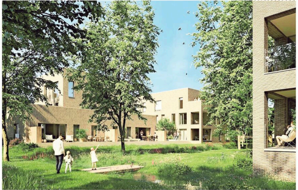
Dammepark moet er op termijn zo uitzien.

Sinds Parts & Components sloot in 2013, ligt de bedrijfssite er verlaten bij. Het terrein is zeer goed gelegen - in een doodlopende straat en op een steenworp van het centrum - en wekte dan ook de interesse van projectontwikkelaar GML Estate.